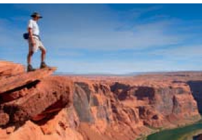
Dobrodružstvá v Colorado

Onedlho začneme aj naše cestovné semináre cestami na najkrajšie miesta planéty. Na rozdiel od iných, u nás máte vždy na výber!