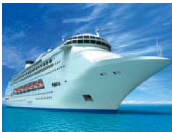
Plavba v Karibiku