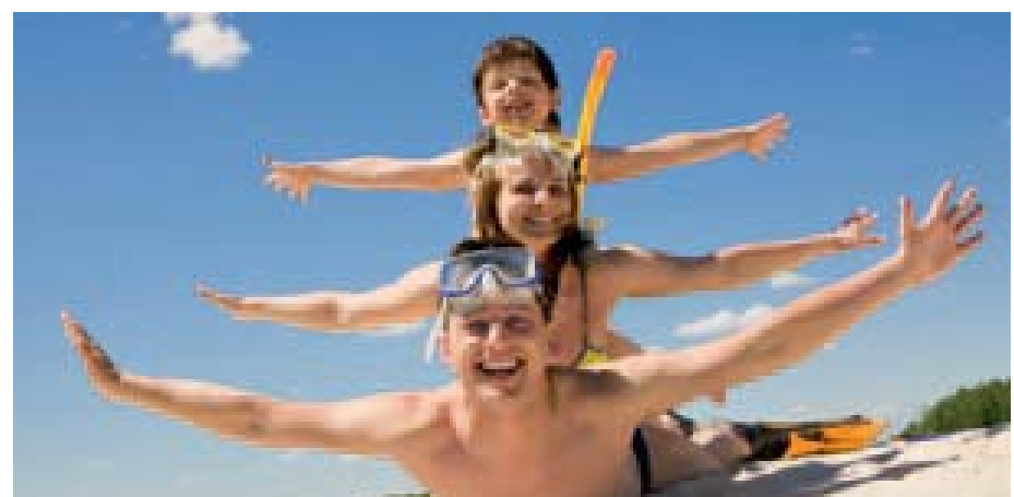
Rodinná dovolenka v Dubaji